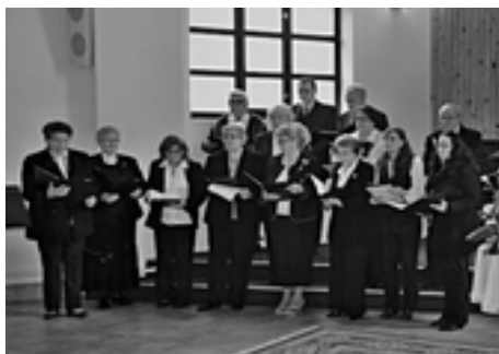
Vystúpenie spevokolu v Michalovciach