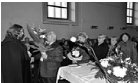
humenský a vranovský cirkevný zbor