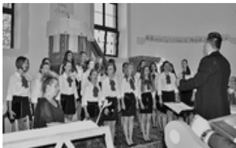
Spevokol a dirigent