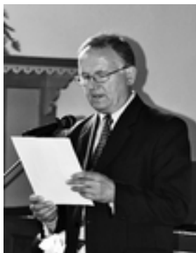
Revízná a kontrolná správa – J. Marcinčák