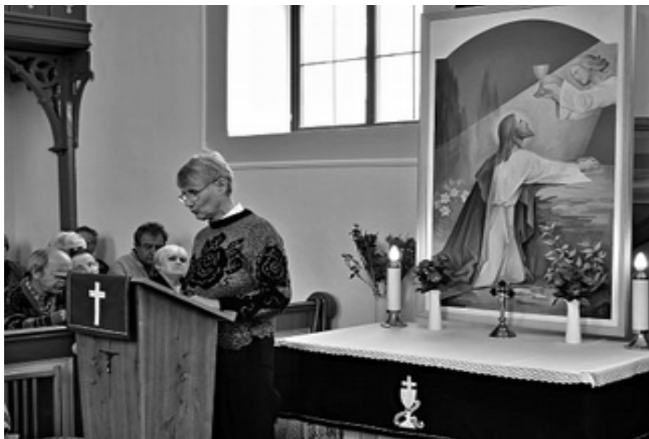
tretia zástavka veriacich v Reformovanom kostole