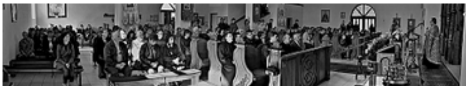
druhá zástavka v pravoslávnom chráme Cyrila a Metóda