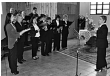
Spevokol z Lastomíra