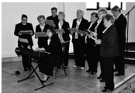
Spevokol zo Záhora