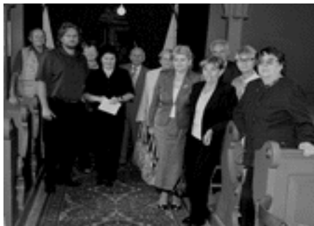
Spoločné zasadnutie presbytérií RKC a ECAV

19. júna - Ekumenické „ Slávenie eucharistie “, ktoré sa konalo slávnostne na námestí pred Mestským kultúrnym strediskom v Humennom za účasti zástupcov cirkevných zborov v Humennom.