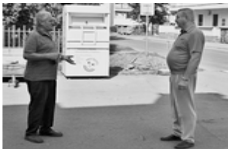
Konzultácia so stavebným dozorom

Niekoľko spomienkových fotografií človeka, ktorý aj keď bol veriacim evanjelikom, chodil pravidelne na reformované služby Božie. Bol aktívnym členom nášho spevokolu „EKUMENA“, ale vykonal veľa práce aj pri stavebných akciách pri renovácii nášho kostola.