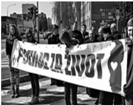
mládež nesúca oznam o pochode