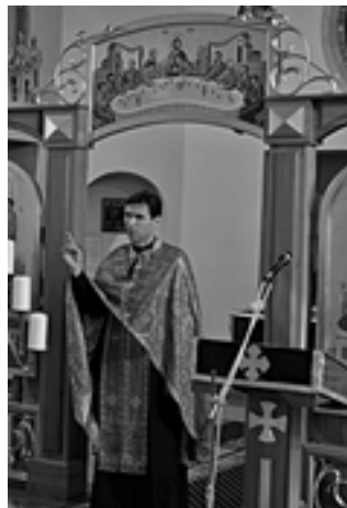
posledná štvrtá zástavka v chráme Zosnutia presvätej Bohorodičky