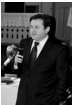
Príhovor M. Hamariho zástupcu biskupa za Slovenských veriacich