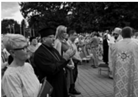
Zástupcovia cirkvi a mesta Humenné