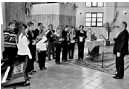
Spevokol z Paľína