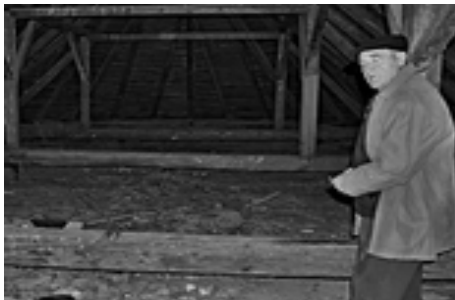
Riešenie úpravy povaly nad modlitebňou