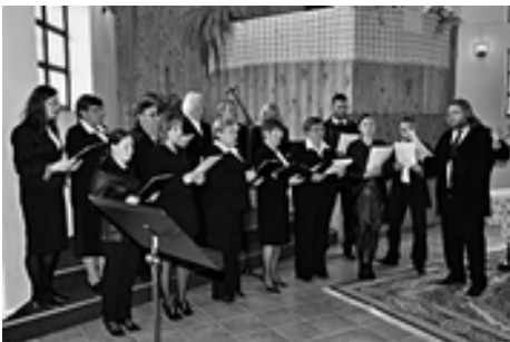
Spevokol z Trhovišťa