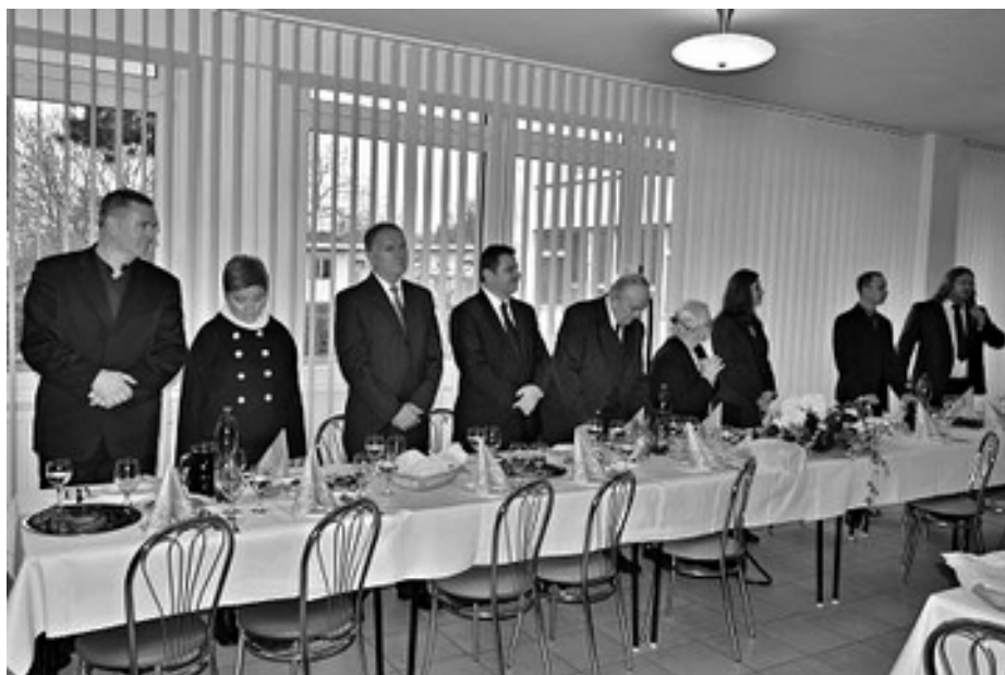
Slávnostné pohostenie pripravil miestny cirkevný zbor pre všetkých účastníkov, kde sa v družnom rozhovore rozprávalo o živote v zboroch