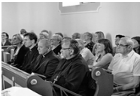
Zástupcovia cirkevných zborov a primátorka mesta