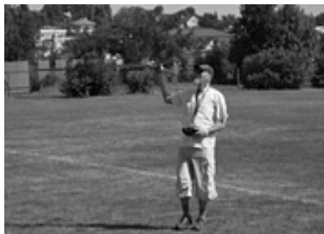
Ukážka s modelom lietadla