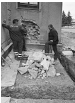
Zemné a búracie práce z východnej a západnej strany veže

19. septembra – sa začala betonáž základov ako aj prístrešku na skladovanie stavebného materiálu a nadbytočného materiálu uloženého v kostole na chóre.