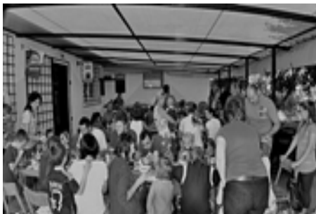
Guláš a sladkosti čo napiekli mamky