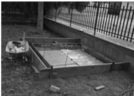
Betonážne práce na prístavbe prístrešku